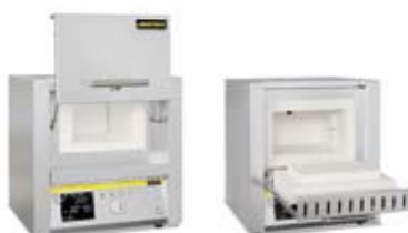
LTシリーズ (上下スライド扉タイプ)